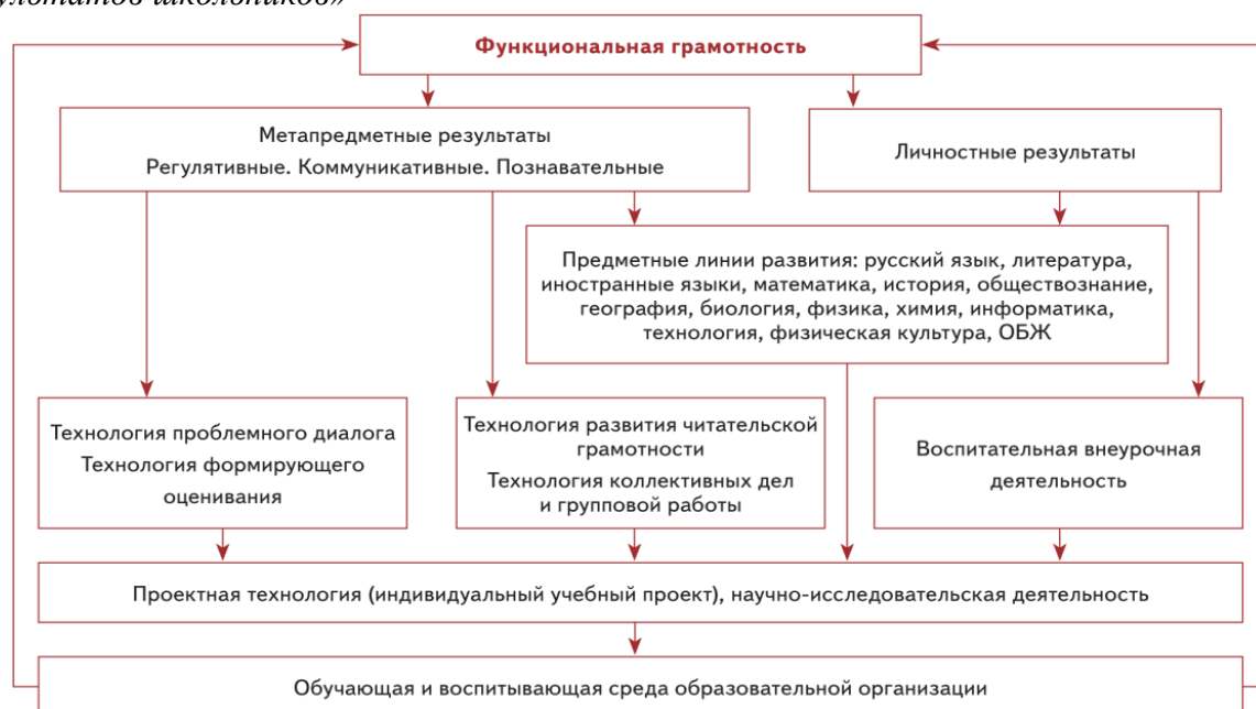
Схема «Система работы школы по обеспечению личностных и метапредметных (УУД) результатов школьников»

Из схемы видно, что существует несколько механизмов развития личностных и метапредметных результатов: